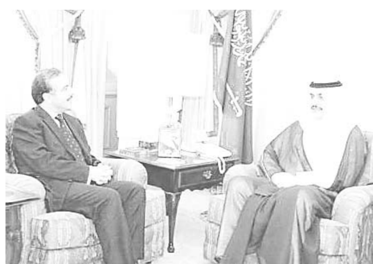
سموه يستقبل سفير تونس

استقبل صاحب السمو الملكي الامير محمد بن فهد الشرقية بمكتب سموه بالامارة بعد ظهر امس «السيث» السفير التونسي لدى المملكة. وتم خلال اللقاء تبادل الاحاديث الودية واستعراض العلاقات الاخوية بين المملكة وتونس. ويستقبل سموه اليوم «الاحد» السفير البنجلاديشي.