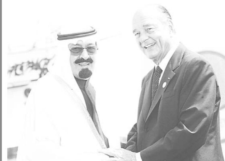
مصافحة حارة بين الأمير عبدالله والرئيس الفرنسي في افيان