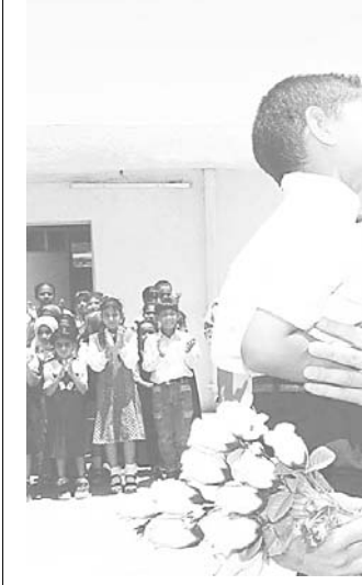
بلير يعالج آثار الحرب على العراق بقبيلة حانية

الدبلوماسيون الاجانب في العراق بدون حصانة محمد المداح (واشنطن) اعلنت وزارة الخارجية الامريكية امس ان الدبلوماسيين الاجانب الموجودين في العراق فقدوا خصوصية وضعهم الدبلوماسي من حصانة وامتيازات كانت لهم خلال عهد صدام حسين وقالت الوزارة ان واشنطن تنصح الدول الاخرى بعدم اعادة تمثيلين عنها الى بغداد قبل استلام حكومة جديدة السلطة. كما باوتشر: ان اوراق الاعتماد المعطاة للممثلين الفلسطينيين خلال عهد صدام حسين اصبحت باطلة مع سقوط النظام العراقي وازداد بموجب الاشراف الذي تمارسه في هذه المرحلة فاننا نحفظ لائسنا بحق ابعاد الأشخاص الذين نظن انهم لا يعمل لديهم هناك. ومن جهة اخرى اختتم توني بلير زيارة للعراق والكويت امس. (التفاصيل ص ١٢)