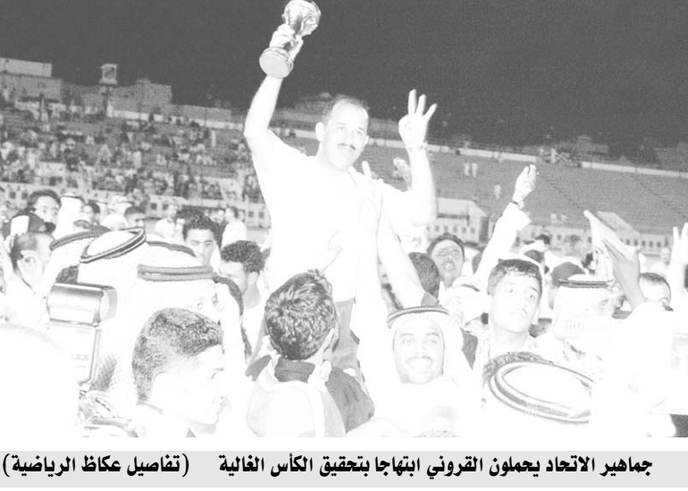
جماهير الاتحاد يعمون القروني ايتهاجا بتحقيق الكأس الغالية (تفاصيل عكاظ الرياضية)