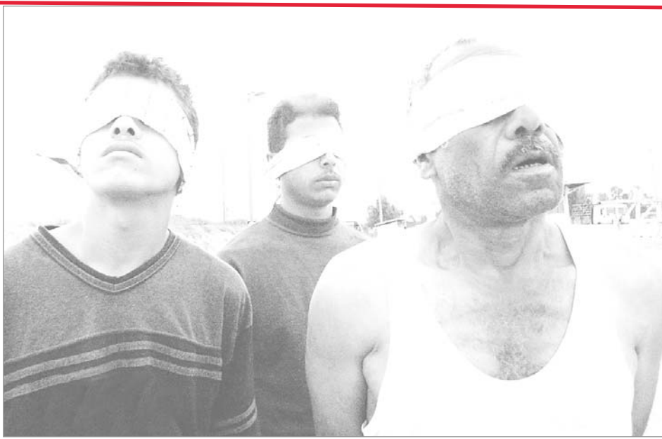
معتقلون فلسطينيون مصوبو العينين عند نقطة تفتيش اسرائيلية أمس

السفير الأمريكي: المملكة قدمت أفضل رعاية لمصابي التفجيرات حزام العتيبي (الرياض) التي سفير الولايات المتحدة الامريكية لدى المملكة روبرت جوردان على ما قدمته المملكة من عناية ورعاية للمصابين في حوادث التفجيرات الارهابية التي وقعت في الرياض مؤخرا واشاد جوردان بشجاعة وارحية الاطباء والمرضين ورجال الدفاع المدني والمواطنين والمقيمين في المملكة الذين تدافعوا لانتقاذ المصابين والعناية بهم. (التفاصيل ص ٣)