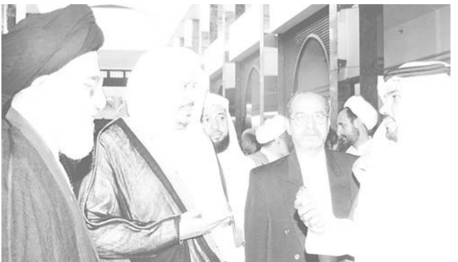
آل الشيخ وهاشمي يتحدثان لبعكاظ،

في المملكة وايران ينطلق من الشريعة الاسلامية السمحة يذكر ان الوفد الايراني سيخادر الى المدينة المنورة ومكة المكرمة اعتبارا من اليوم ويلتقي رئيس مجلس الشورى الدكتور صالح بن حميد في مكة المكرمة بعد غد الاربعاء.