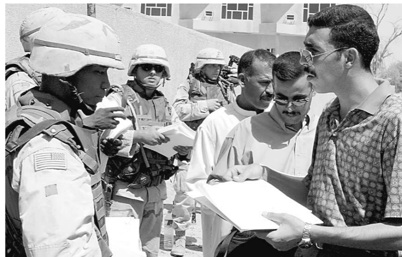
عراقيون يتسلمون نماذج من طلبات الانتساب الى الجيش العراقي الجديد من جنود امريكيين في بغداد امس.

القانونون تقع على التحالف (الاميركي البريطاني) وحده، موضحة ان «اقامة قوة لشرطة دولية برعاية الامم المتحدة يمكن ان يؤدي الى ظهور نظام مواز لتطبيق القانون لا يتخضع للفاعلية». وتابع ان «الرسالة الرئيسية» التي نقلت اليه من قبله ان «الديمقراطية لا يمكن ان تفرض من الخارج ويجب ان تأتي من الداخل». وبعطاء «سلطات تنفيذية فعلية الى الممثلين العراقيين من بيننا ادارة موارد الميزانية».