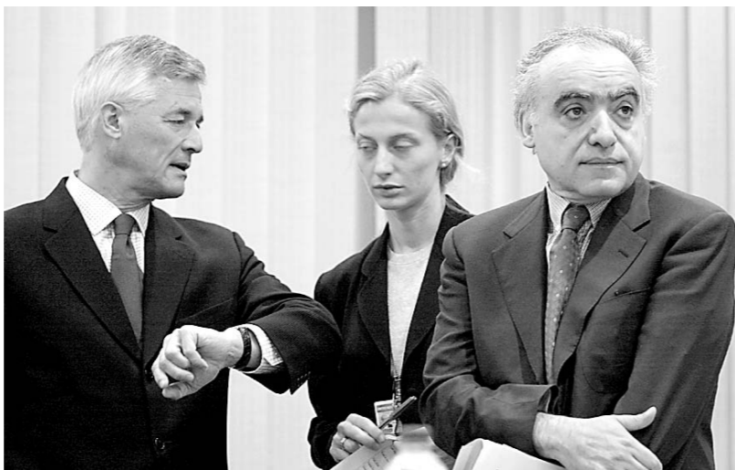
الممثل الخاص لامين عام الامم المتحدة في العراق سيرجيود ميلاو ينظر الى ساعته والى جانبه مستشاره الدكتور غسان سلامة، قبيل انعقاد جلسة مناقشة البنتاغون في بغداد امس.

القانونون تقع على التحالف (الاميركي البريطاني) وحده، موضحة ان «اقامة قوة لشرطة دولية برعاية الامم المتحدة يمكن ان يؤدي الى ظهور نظام مواز لتطبيق القانون لا يتخضع للفاعلية». وتابع ان «الرسالة الرئيسية» التي نقلت اليه من قبله ان «الديمقراطية لا يمكن ان تفرض من الخارج ويجب ان تأتي من الداخل». وبعطاء «سلطات تنفيذية فعلية الى الممثلين العراقيين من بيننا ادارة موارد الميزانية».