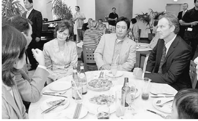
رئيس الوزراء البريطاني توني بلير وزوجته تشريلي يتعدان مع افراد عائلة يابانية داخل أحد المطاعم في طوكيو امس.

صرح رئيس الوزراء البريطاني توني بلير امس في طوكيو ان وفاة الخبير الحكومي في الاسلحة الجروموية ديفيد كيلي «مأساة رهيبه» مؤكدا ضرورة «كشف مالبسات هذه القضية بدقة». وأضاف «اشعر بحزن عميق على كيلي وعائلته. لقد قدم الكثير لبلده في الماضي واتنى واثق انه كان سيفعل ذلك في المستقبل». وأكد بلير «سكوتون هناك عملية ملائمة وحسب الاصول لاجراء تحقيق مستقل واعتقد ان ذلك سيسمح بكشف الحقائق»، معبرا عن اسلمه في ان «تضع جانباً التكتونات والتأكدات والتأكدات المضادة لنسجم باجراء هذه العملية». وتابع «انتظار ذلك علينا جميعاً من مسؤولين ووسائل اعلام ان نبرهن على الاحترام وضبط النفس». وكان كيلي (٥٩ عاماً) فقد الخميس. وقد عثر الجمعة على جثة تنطبق على صفاته لكن التعرف رسمياً على الجثة يجري امس.