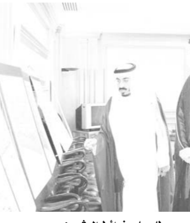
سموه يطلع على خرائط المشروع

وأشار الى انه كان قد تم في السابق شراء أرض قريبة من الاوادم بدعم سموه لكن لبعدها كثيراً من الخدمات تفضل سموه بشراء أرض جديدة بـ «٨» ملايين ريال في أحد احياء الدمام. وعن مدة تنفيذ المشروع قال: انها ستستغرق حوالي عامين.. وتبلغ تكلفته الاجمالية «٣٦» مليون ريال.