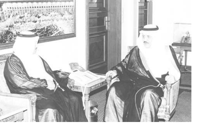
سموه يستقبل سفير البحرين