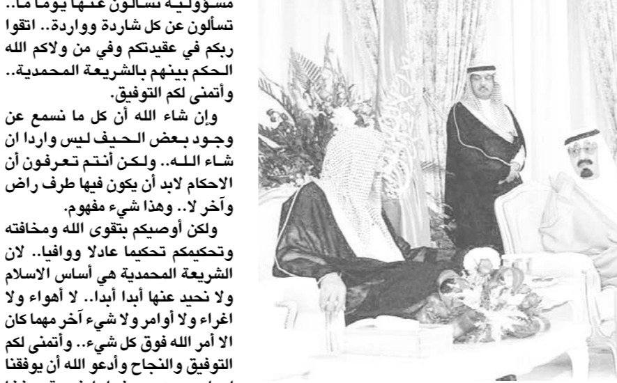
سمو ولي العهد يستقبل اصحاب الفضيلة العلماء والمشايع

تسلم صاحب السمو الملكي الأمير عبدالله بن عبدالعزيز ولي العهد نائب رئيس مجلس الوزراء ورئيس الحرس الوطني رسالة من دولة رئيس وزراء كندا جون كريتيان. وقام بتسليم الرسالة لسمو ولي العهد عضو مجلس الشيوخ الكندي السيناتور بيير ديبيانته خلال استقبال سموه له في مكتبه بمحافظة الطائف. ونقل السيناتور ديبيانته لصاحب السمو الملكي الأمير عبدالله بن عبدالعزيز تحيات وتقدير دولة الرئيس جون كريتيان فيما حمله سموه تحياته وتقديره لدولته. حضر الاستقبال صاحب السمو الملكي الأمير متعب بن عبدالعزيز وزير الشؤون البلدية والقروية وصاحب السمو الأمير فيصل بن عبدالله بن محمد آل سعود مساعد رئيس