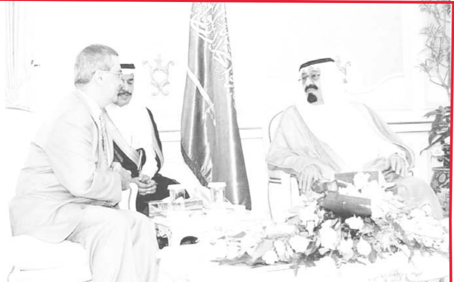
سموه يستقبل عضو مجلس الشيوخ الكندي