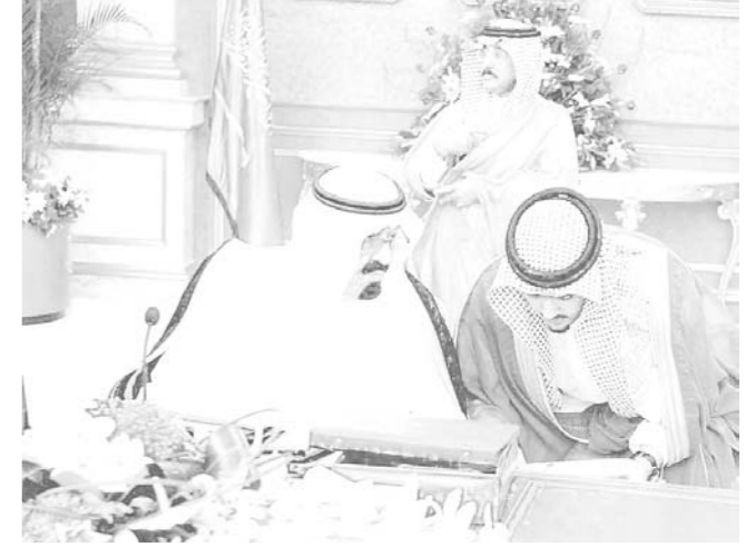
سمو ولي العهد يوجه الأمير عبدالعزيز

أكد صاحب السمو الملكي الأمير عبدالله بن عبدالعزيز ولي العهد نائب رئيس مجلس الوزراء ورئيس الحرس الوطني لدى رئاسته جلسة مجلس الوزراء أمس على أهمية المحافظة على أمن الوطن وأنه واجب منوط بماتق كل مواطن ومواطنة وأشار سمو ولي العهد بارتياح إلى صورة من صور الالتفاف والتلاحم بين المواطنين والقيادة الذي تمثل بالجهود الأسرية المشكورة وذلك بتسليم أو الإبلاغ عن المطلوبين بما يدل دلالة واضحة على تعاونهم البناء مع مسؤولي الأمن لصالح الوطن العزيز. واستمع المجلس إلى العرض من سمو النائب الثاني عن زيارته لليمن ولقائه الرئيس علي عبدالله صالح ونتائج اجتماعات الدورة ١٥ لمجلس التنسيق السعودي اليمني وما سادها من أجواء أخوية عكست عمق الصلة وتجزر العلاقة بين الشعبين. (التفاصيل ص ٣)