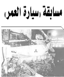
وفاة ثلاثة في حادث بالساحل