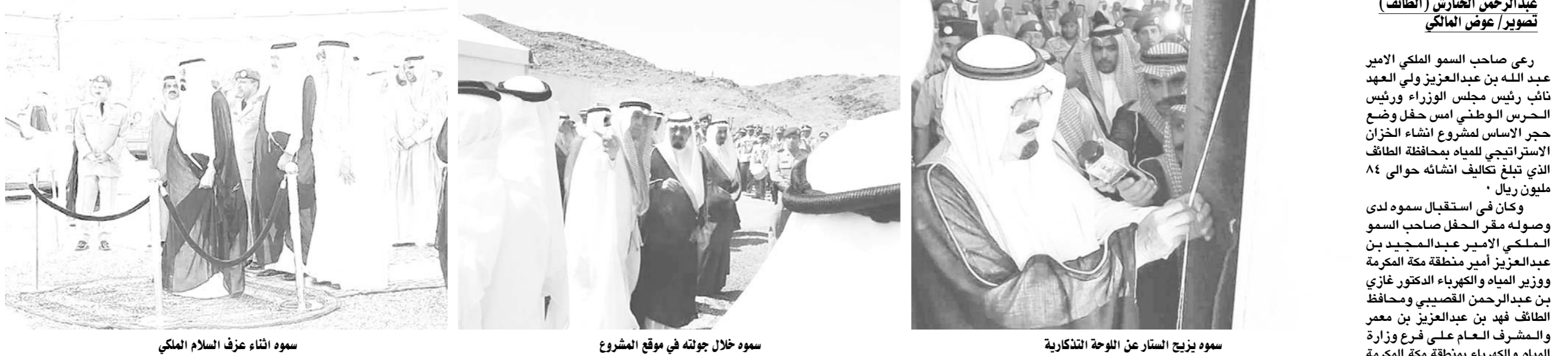
سمو ولي العهد لدى وضع أساس مشروع الخزان الاستراتيجي للمياه