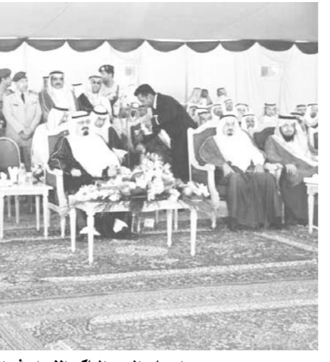
سمو واصحاب السمو الملكي الامراء في الحفل

العهد وسمو النائب الثاني حفظهم الله على اعتماد تنفيذ هذا المشروع الحيوي المهم بالمحافظة الذي يضاف الى الكثير من الانجازات التنموية التي تحققت بفضل من الله ثم بفضل دعم واهتمام الحكومة الرشيدة ٠ كما عبروا عن شكرهم لصاحب السمو الملكي الامير عبدالمجيد بن عبدالعزيز أمير منطقة مكة المكرمة على متابعتة الدائمة والمستمرة لكافة المشروعات والخدمات التي تخدم المواطن والزائر بالمنطقة عامة وبمحافظة الطائف خاصة ٠ بعد ذلك تسلم سمو الامير عبدالله بن عبدالعزيز هدية تذكارية بهذه المناسبة من وزير المياه والكهرباء الدكتور غازي القصيبي كما تسلم