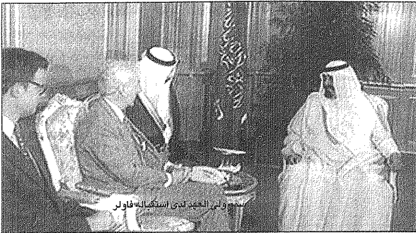
سمو ولي العهد لدى استقباله لأمير الولايات المتحدة