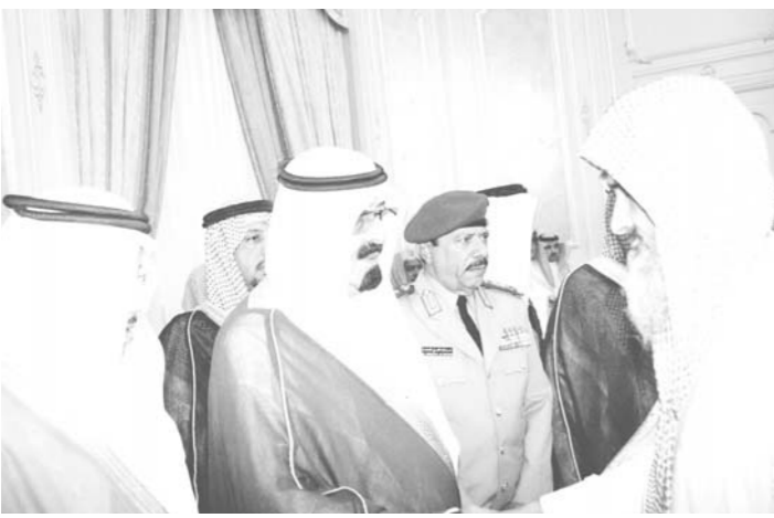
سمو ولي العهد يستقبل الامراء والمواطنين ووفودا من قبائل جازان ومكة

فيصل بن تركي آل سعود وصاحب السمو الملكي الامير عبدالعزيز بن فيصل بن تركي بن عبد العزيز وصاحب السمو الامير فيصل بن مساعد بن عبدالرحمن وصاحب السمو الامير الدكتور بندر بن سلمان بن محمد آل سعود المستشار في ديوان سمو ولي العهد.