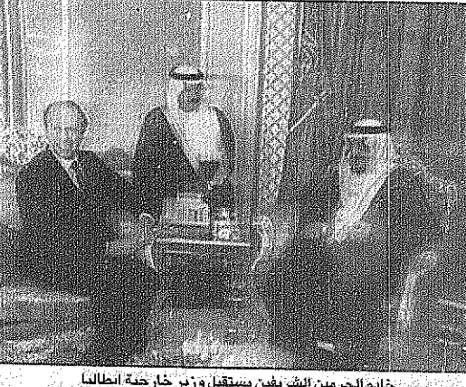
خادم الحرمين الشريفين يستقبل وزير خارجية ايطاليا