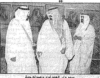
سمو ولي العهد لدى وصوله جدة

واس-جدة بحفظ الله ورحمته وصل صاحب السمو الملكي الامير عبدالله بن عبدالعزيز ولي العهد ونائب رئيس مجلس الوزراء ورئيس الحرس الوطني الى جدة بعد عصر امس قادماً من حفر الباطن بعد زيارة تفقدية لها. وكان في استقبال سموه بمطار الملك عبدالعزيز الدولي صاحب السمو الملكي الامير سلطان بن عبدالعزيز النائب الثاني لرئيس مجلس الوزراء وزير الدفاع والطيران والمفتش العام وصاحب السمو الامير بدر بن محمد بن عبدالعزيز صاحب السمو الملكي الامير سلمان بن عبدالعزيز امير منطقة مكة المكرمة وعدد من اصحاب السمو الملكي الامراء واصحاب المعالي الوزراء وكبار المسؤولين من مدنيين وعسكريين وجمع من المواطنين. وكان سمو ولي العهد قد غادر بحفظ الله ورحمته مطار قاعدة الملك خالد العسكرية في حفر الباطن في وقت سابق امس وكان في وداع سموه صاحب السمو الملكي الامير عبدالمنعم بن عبدالعزيز نائب رئيس الحرس الوطني وصاحب السمو الملكي الامير مقرن بن عبدالعزيز امير منطقة الشرقية إضافة الى عدد من اصحاب السمو الملكي الامراء واصحاب المعالي الوزراء وجمع من المواطنين وكبار قادة وضباط المنطقة الشمالية. (تفاصيل ٤)