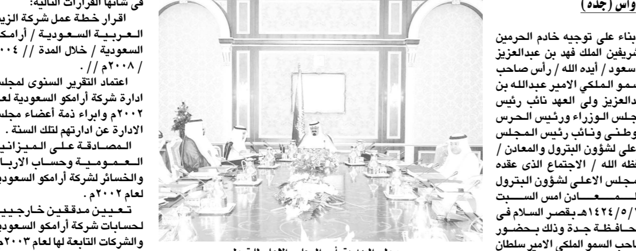
سمو ولي العهد يرأس المجلس الاعلى للبترول