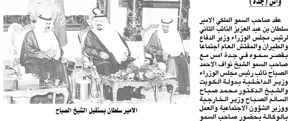
الامير سلطان يستقبل الشيخ الصباح

واس (جدة) - عقد صاحب السمو الملكي الامير سلطان بن عبدالعزيز النائب الثاني لرئيس مجلس الوزراء وزير الدفاع والطيران والمفتش العام اجتماعاً بقصر سموه في جدة أمس مع صاحب السمو الشيخ نواف الاحمد الصباح نائب رئيس مجلس الوزراء وزير الداخلية بدولة الكويت والشيخ الدكتور محمد صباح السالم الصباح وزير الخارجية ووزير الشؤون الاجتماعية والعمل بالكويت بحضور صاحب السمو الملكي الامير نايف بن عبدالعزيز وزير الداخلية.