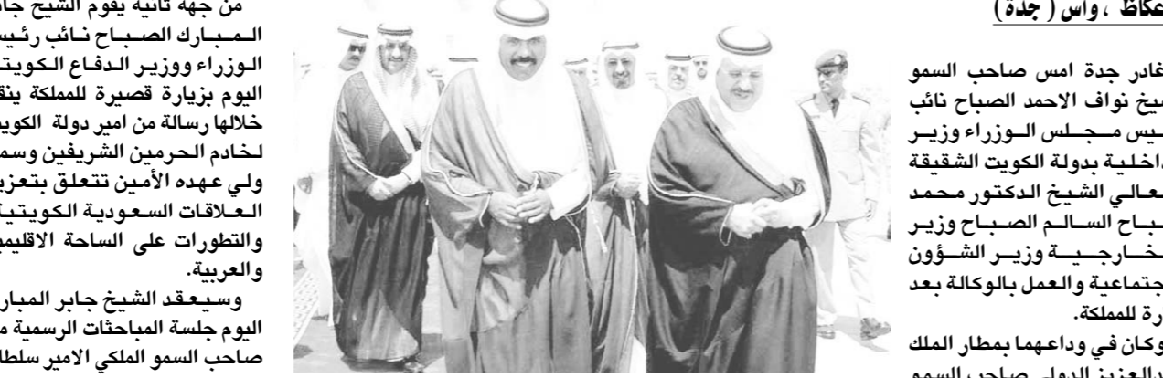
الامير نايف يستقبل الصباح لدى وصوله الى جدة امس

عكاظ ، واس (جدة) - غادر جدة امس صاحب السمو الشيخ نواف الاحمد الصباح نائب رئيس مجلس الوزراء وزير الدفاع والطيران والمفتش العام، ورافقهما امس في وداعهما مدير الامن العام الفريق سعيد بن عبدالله القحطاني ومدير عام الجوازات اللواء عبدالعزيز سجينى ونائب مدير عام المباحث العامة اللواء منصور الضلعان ومدير شرطة منطقة مكة المكرمة اللواء علي بن حجاب الفقيهي وقائد حرس الحدود بمنطقة مكة المكرمة العميد عبدالحميد بن محمد المورعي. وكان صاحب السمو الشيخ