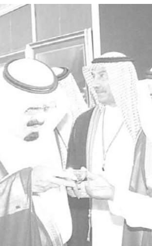
سمو ولي العهد لدى وصوله مقر الحفل

الانضباط وسرعة نقل وتبادل المعلومات وتحليلها واتخاذ القرار. وواضح ان وزارة الحج بدأت منذ عامين في تصحيح نظام الكتروني شارك في دراسته افضل شركات تقنية المعلومات في العالم وتم الانتهاء منه مما يمكن من فتح ملف الكتروني لكل مستثمر ويساعد المعتمر في اي بقعة في العالم من الدخول على الشبكة ومعرفة برامج العمرة المتاحة من قبل شركات العمرة السعودية واختيار ما يناسبه وحتى دفع قيمة البرنامج والحصول على تأشيرة الدخول وذلك خلال ٢٤ ساعة فقط وواضح ان الشبكة تستوعب حتى ٢٠ مليون معتمر سنوياً وتطرق لانشاء مركز معلومات الحج والعمرة والذي ساهم القطاع الخاص في