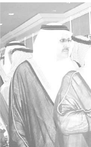
سمو ولي العهد لدى وصوله مقر الحفل

انشائه بطريقة الشراكة والاستثمار مع القطاع الخاص وقال ان المركز يستخدم أحدث تقنية امن المعلومات وتبادلها اوضح انه تم التصريح في هذا الخصوص لاربع شركات سعودية لتقديم خدمة تقنية للمعلومات لشركات العمرة تتعامل مع ٢١٠ شركات ومؤسسات سعودية ونحو ٣٥٠٠ وكيل خارجي في اكثر من ١٦٠ بلداً في العالم ويكثرون ويسر وشركات لتأمين لبيستفيد منها المسلمون في جميع انحاء العالم ولتصبح وزارة الحج قادرة على القيام بدورها على اكمل وجه حيث توفر شبكة الحج والعمرة مواردنا ذاتياً دون الحاجة لتمويلات حكومية وتدار بايد سعودية مؤهلة. وواضح ان الاستثمارات في هذه الشركات زاد عن مليار ريال واصبحت وزارة الحج تمثل نمونجا واضحا في الشراكة مع القطاع الخاص وخصخصة خدماتها بينما تقوم الوزارة بالدراسات والابحاث والمناقصات والاشراف وقال ان الوزارة استكملت البنى التحتية التقنية لربط مكاتبها في مكة المكرمة والمدينة المنورة والرياض وجدة بالإضافة للمؤسسات العاملة معها في الحج والعمرة لتمويل وزارة الحج لوزارة اتقرونية وشكر سمو الامير عبدالله على دعمه وتشجيعه لمشروعات وزارة الحج مما يحقق تطلعات خادم الحرمين الشريفين لضمان راحة وسلامة الحجاج