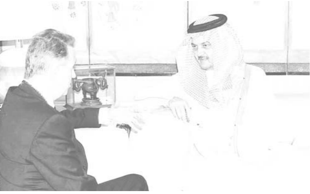
سموه لدى استقباله مبعوث الأمم المتحدة

استقبل صاحب السمو الملكي الامير سعود الفيصل وزير الخارجية بقصر سموه في جدة أمس مبعوث الأمين العام للأمم المتحدة تري لارسن. وتم خلال الاستقبال استعراض القضايا الدولية والاقليمية ذات الاهتمام المشترك وقد حضر اللقاء مدير عام فرع وزارة الخارجية بجدة الدكتور عبدالعزيز الصويغ. كما استقبل صاحب السمو الملكي الامير سعود الفيصل وزير الخارجية بقصر سموه في جدة أمس سفير الهند لدى المملكة تلميذ احمد وسفير ألمانيا الدكتور هارالد كيندر مان كل على حدة حيث ودعا سموه بمناسبة انتهاء فترة عملها بالمملكة. كما استقبل سموه أمس سفراء كل من اليابان ياسوؤو سائيتو وكوريا الجنوبية كانج كوان ون وإيطاليا ارامندوا سانجوني كل على حدة والذين قدموا لسموه صوراً من اوراق اعتمادهم تمهيدا لتقديمها لخادم الحرمين الشريفين الملك فهد بن عبدالعزيز آل سعود كسفراء لدى المملكة.