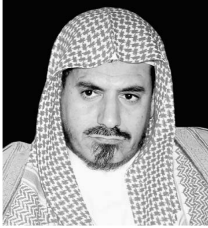
د. ابن حميد

الاعلى او القوى العاملة او التعليم العالي كلها تؤدي دوراً في تقديم ما يتطلبه التطوير والتحديث. * لکن هناك من يرى ان دوركم الرقابي على الاجهزة الحكومية ضعيف؟ * ابدا.. رقيبنا تعتبر رقابة لاحقة باعتبار اننا ننظر في تقارير الاداء الحكومي التي يناقشها المجلس بقوة ووضوح وشفافية ويقدم توصيات فيها من الوجود والقوة بما يتطلع اليه المجلس وحتى المواطن وكذلك زميلنا في الجهاز التنفيذي ليكون الاداء افضل. لا حرج ولا مجاملة * ولكن هناك من يرى ايضا ان مناقشاتكم للوزراء الذين يستدعيهم المجلس لا تقوم على الوضوح والمكاشفة بقدر ما تقوم على المجاملات؟ * ابدا.. واؤكد لك هذا تماماً.