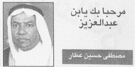
مرحبا بك يابن عبدالعزيز