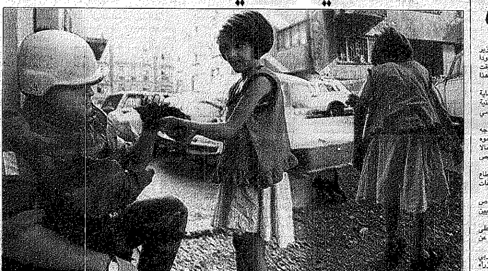
بعد ان احرقت الحرب الطفولة ولم يعد هناك ما يبيح... رتت هذه الطفلة ان ترطب بضميرها الشاكرين على احتراق بلدها وان الورود خذت لم تجد هذه الطفلة شيئا حيا يمكن ان تهيمه لاحد جنود الامم المتحدة سوى قطة ركعت وامسكت بالقطعة ودفنتها هدية. وكأنها تصر على ان يلاذها تنواتا لتخرج من هذا الحريق