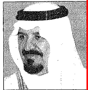
سمو الأمير سلطان

واس - خميس مشيط: قام صاحب السمو الملكي الأمير سلطان بن عبدالعزيز أمير المنطقة الجنوبية... والوفد الذي رافقه... ومعه من ضباط قيادة المنطقة الجنوبية