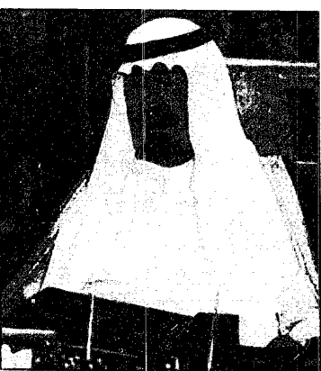
سمو ولي العهد لدى رئاسته جلسة مجلس الوزراء

سمو ولي العهد مؤكدا أهمية التركيز على أساليب التقنية التي تتلاءم مع متطلبات الاقتصاد الوطني : تنمية قدراتنا الذاتية التقنية من ضرورات نجاح خططنا التنموية واس - جدة : وصف صاحب السمو الملكي الامير عبدالله بن عبدالعزيز ولي العهد نائب رئيس مجلس الوزراء ورئيس الحرس الوطني الإتفاقية الأمنية السعودية اليمنية التي وقعتها يوم السبت الماضي في جدة صاحب السمو الملكي وزير الداخلية ومعالي وزير الداخلية اليمني بأنها طيبة وبناءة لتعزيز الجوانب الأمنية المختلفة بين البلدين الشقيقين. وأعرب سمو ولي العهد في جلسة مجلس الوزراء التي رأسها رعاها الله معالي امير الإثني عشر الساعات في جدة عن ارتياحه لما حققته التعليم بنسبة العام والعالي خلال السنة الدراسية ١٤١٦ هـ حيث استطاعت جامعاتنا السبع وكليات المعلمين وكليات البعثات تخريج أعداد وفيرة من حملة البكالوريوس في جميع الاختصاصات النافعة حيث ارتفع المجموع إلى ٣٦٢ مواطناً ومواطنة. وبادى سموه الكرم نقلاً له بمستقبل سعودي واعد في المجالات العلمية والتقنية مستنداً في ذلك على لغة الأرقام إذ إن نسبة توجيحه حركة التطور العلمي والتقني السعودي والأساسية الكلية بشهد الموارد والإمكانات اللازمة لتحقيق القطاع الخاص.