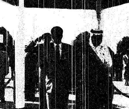
سمو الامير نايف يودع عرب

تحيات الملك وسمو ولي العهد ينقلها الفارسي للرئيس التونسي واس - تونس : استقبل فخامة الرئيس زين العابدين بن علي رئيس الجمهورية التونسية أمس معالي وزير الإعلام الدكتور فؤاد بن عبدالسلام الفارسي الذي يزور تونس حالياً. عقب المقابلة أوضح معالي وزير الإعلام أنه أشرف بشكل شخصي على تسليم تحيات وتبرير خادم الحرمين الشريفين الملك فهد بن عبدالعزيز آل سعود وصاحب السمو الملكي الامير نايف بن عبدالعزيز آل سعود إلى الرئيس زين العابدين بن علي. وبين معاليه أن فخامة الرئيس زين العابدين بن علي قد رغب اليه نقل فائق تقديره لأخوه خادم الحرمين الشريفين الملك فهد بن عبدالعزيز آل سعود وصاحب السمو الملكي الامير نايف بن عبدالعزيز آل سعود. وأضاف معالي وزير الإعلام أن فخامة الرئيس زين العابدين بن علي قد حرص على زيادة عرى العلاقات والصلات المتينة القائمة بين المملكة العربية السعودية والجمهورية التونسية لكل ما فيه مصلحة شعبي البلدين الشقيقين والأمة العربية والإسلامية جمعاء.