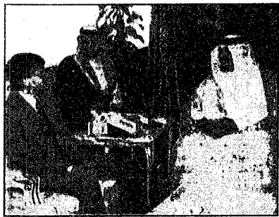
سمو الامير سلطان لدى استقباله السفير الكندي

محمد الحنايا - بريدة واس - جدة - عمان اجري صباح السبت سمو الملكي الامير سلطان بن عبدالعزيز نائب الامير الثاني السعودي ورئيس مجلس الوزراء وزير الدفاع والطيران والمفتش العام انس اتصالاً هاتفياً باخيه جلالة الملك حسين ملك المملكة الأردنية الهاشمية هنأه فيه على سلامته وانعاشه على صحته بعد العملية الجراحية التي اجريتها لجلته. وقالت ابنة عمان ان سمو الامير سلطان بن عبدالعزيز اعرب عن صادق امتنانه لجلالة الملك حسين بالصحة والعافية والشفا والبركة بالجزيرة من التقدم والازدهار. من جهة ثانية استقبل سموه امس السفير الكندي لدى المملكة بيتر سترلاند بمناسبة انتهاء فترة عمله في المملكة. في المصحة في سمو النائب الثاني عصير يوم السبت القادم طريقين من طريق الخارجي لمدينة بريدة والجيزة المنفذ من طريق الرياض المدينة المنورة السريع وفي تصريح بهذه المناسبة عبر مدير عام الطرق بمنطقة القصيم المهندس احمد العبدالله عن عظيم شكره وتقديره لسمو النائب الثاني على تفهله وافتتاح مدين المشروعين العمالين