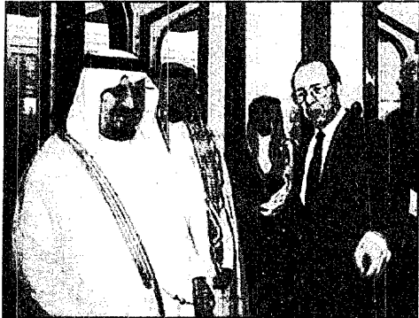
سمو النائب الثاني يستقبل ييري