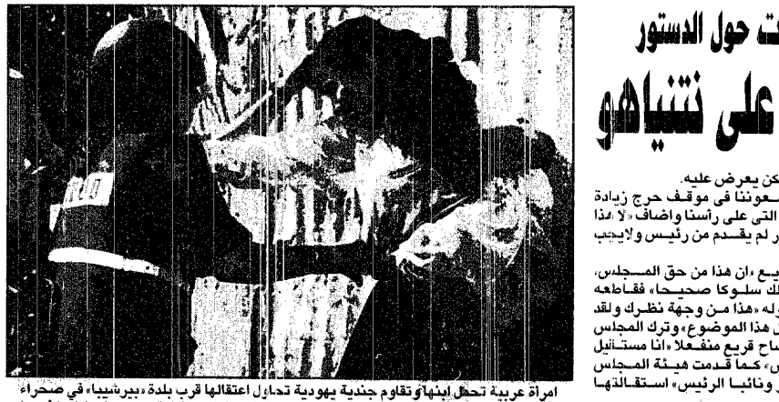
امراء عربية تحلل ابيها وتقاوم جندية يهودية تحاول اعتقالها قرب بلدة بيرزيبيا، في صحراء النقب حين جرت عملياتها بين الاممالي العرب، والشرطة الاسرائيلية.