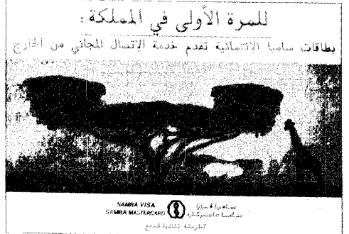
للمرة الأولى في المملكة:

بطاقات سامية الإستهائية تقدم خدمة الإتصال المجاني من الخارج