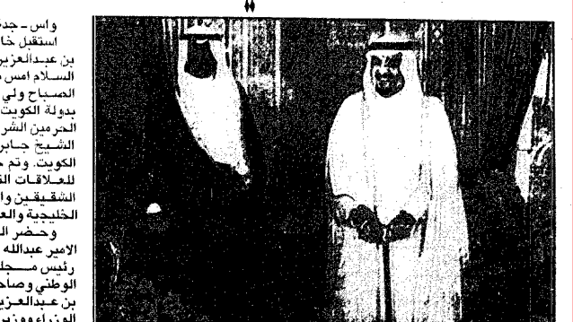
خادم الحرمين الشريفين يستقبل الشيخ سعد