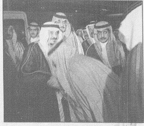
خادم الحرمين الشريفين لدى وصوله الى مطار الملك خالد الدولي بالرياض وسط حشد من المستقبين له حفظه الله وتهنئته بسلامة الوصول