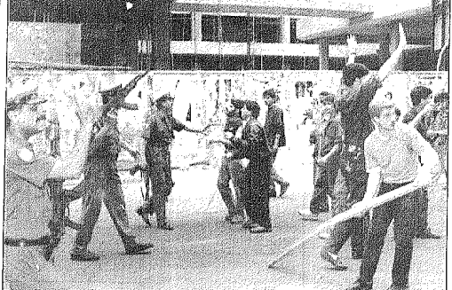
رجال الشرطة اللبنانيين يحاولون منع المتظاهرين من تهب محطات الصرافة في حي الحمراء بيروت أمس في إطار اضراب عام نظم احتجاجاً على الأوضاع الاقتصادية المتدهورة.