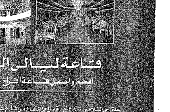
عندما تتاح لك فرصة من الشرق من خارج بلادنا