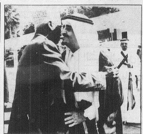
خادم الحرمين يودع جوليد

واس ( جدة - مسقط ) بعث خادم الحرمين الشريفين الملك فهد بن عبدالعزيز آل سعود برسالة الى أخيه جلالة السلطان قابوس بن سعيد سلطان عمان وقام بتسلم الرسالة معالي وزير الاعلام الأستاذ علي الشاعر لدى استقبال جلالة السلطان له في صحنه أمام ومن ناحية أخرى استقبل خادم الحرمين الشريفين الملك فهد بن عبدالعزيز آل سعود حفلة الله بعد ظهر أمس فخامة الرئيس حسن جوليد رئيس جمهورية جيبوتي وحضر المقابلة صاحب السمو الملكي الأمير عبدالله بن عبدالعزيز ولي العهد ونائب رئيس مجلس الوزراء ورئيس الحرس الوطني وصاحب السمو الملكي الأمير ماجد بن عبدالعزيز أمير منطقة مكة المكرمة ومعالي المستشار الخاص لخادم الحرمين الشريفين الأستاذ إبراهيم العقري وقد غادر فخامة الرئيس حسن جوليد المملكة بعد زيارة قصيرة في طريقه الى بغداد [ تفاصيل ص ٢ - ص ٥ ]