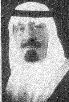
صور ص ه

واس (جدة) - وبخط الله - وبعيته صاحب السمو الملكي الأمير عبدالله بن عبدالعزيز وصل - وبخط الله - وبعيته صاحب السمو الملكي الأمير عبدالله بن عبدالعزيز ولي العهد ونائب رئيس مجلس الوزراء ورئيس الحرس الوطني إلى جدة مساء أمس قادماً من خارج المملكة بعد أن قام بزيارات خاصة لعدد من الدول العربية. وكان في استقبال سموه لدى وصوله مطار الملك عبدالعزيز الدولي صاحب السمو الملكي الأمير فهد بن محمد بن عبدالعزيز وصاحب السمو الملكي الأمير بدر بن عبدالعزيز نائب رئيس الحرس الوطني وصاحب السمو الملكي الأمير فهد بن عبدالعزيز وصاحب السمو الملكي الأمير ماجد بن عبدالعزيز أمير منطقة مكة المكرمة وصاحب السمو الملكي الأمير سعود بن عبدالعزيز رئيس مكتب الدراسات الاستراتيجية وصاحب السمو الملكي الأمير محمد بن عبدالعزيز وصاحب السمو الملكي الأمير أحمد بن عبدالعزيز وصاحب السمو الملكي الأمير سعود الفيصل وزير الخارجية. كما كان في استقبال سموه أصحاب السمو الملكي الأمراء وأصحاب المعالي الوزراء وكبار المسؤولين من مدنيين وسكبريين وجمع من المواطنين حفظ الله سموه في سفره وأقامته.