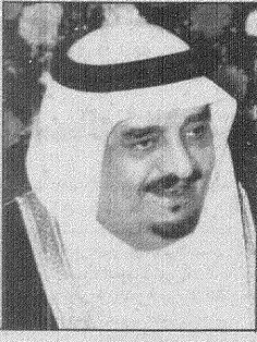
خادم الحرمين الشريفين يهنئ السلطان قابوس وزير العابدين وعبدالقيوم بمناسبة ذكرى استقلال بلاده (تفاصيل ص ٢)

وكالات الأنباء (عواصم) - لم بعد أمام الحكومة العراقية بعد أن وصلت أزمته مع الأمم المتحدة إلى النهاية سوى أن تختار التراجع والسماح لطريق الأمم المتحدة بتفتيش وزارة الزراعة، أو الاستعداد لضربة عسكرية قادمة. وقد وضعت القوات الأمريكية في الخليج في حالة تأهب وضرب متحدث باسم القيادة المركزية «اننا مستعدون لتنفيذ مهمتنا مهما كانت». وقد أكد مارلين فينوتروتر المتحدث باسم الرئيس الأمريكي في بيان أن مجلس الحرب الذي عقده الرئيس جورج بوش مع مستشاريه الرئيسيين صباح أمس في كاتيدريفي للبحر في الموقف الواجب اتخاذها حيال العراق «لم يستعد أي خيار» بينما قطع رالف أيكوس رئيس اللجنة الدولية المكلفة بالتفتيش على أسلحة الدمار التام لدى النظام العراقي وتمهيداً لها. داير اعلمت عراقية بان تقبلاً قد تحقق بشأن نزاع الأمم المتحدة مع النظام العراقي حول قضية وزارة الزراعة العراقية. وقال أيكوس مازالت هناك مسألة رئيسية هامة باقية لم يتم الاتفاق عليها. وأكدت مصادر دبلوماسية في الأمم المتحدة أن أيكوس أبلغ السفير العراقي عبدالامير الاتياري بضرورة تنفيذ كل مطالب الأمم المتحدة. وليس مجرد الموافقة على دخول فريق التفتيش التابع للأمم المتحدة وزارة الزراعة. وقال الاتياري أرجو عقد جلسة واحدة أخرى وان ينتهي كل شيء. وقال وزير الخارجية الأمريكي جيمس بيكر من شأن اثناء اشارت الى احتمال التوصل الى حل وسط بين الأمم المتحدة والنظام في بغداد مشيراً الى أن ذلك يعتبر نموذجاً من النتائج السنية وديلاً على سياسة الخداع التي ينتهجها نظام بغداد والقرارات الدولية. تفاصيل ص ٦