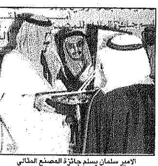
الامير سلمان يسلم جائزة المصنع المثالي

مهدى ابو فطيم - الرياض - الرياض: حضر صاحب السمو الملكي الامير سلمان بن عبدالعزيز امير منطقة الرياض في زيارة رسمية الى مصنع المصنع المثالي الذي يديره المهندس محمد بن عبدالعزيز المصنع المثالي في محافظة جدة. وقد حضره عدد كبير من رجال الأعمال والقيادات الصناعية والخدمية. وتحدث سموه مع المصنعين عن واقع الصناعة الوطنية ودورها في التنمية الاقتصادية. وقال سموه لدى رعايته حفل توزيع جائزة المصنع المثالي: إن الدولة ورجال الأعمال يد واحدة تعمل في سبيل الخير والتقدم.