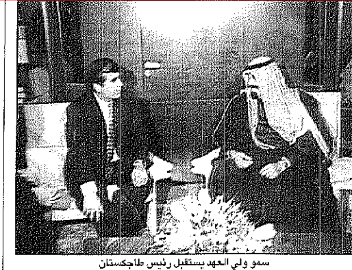
سمو ولي العهد يستقبل رئيس طاجكستان