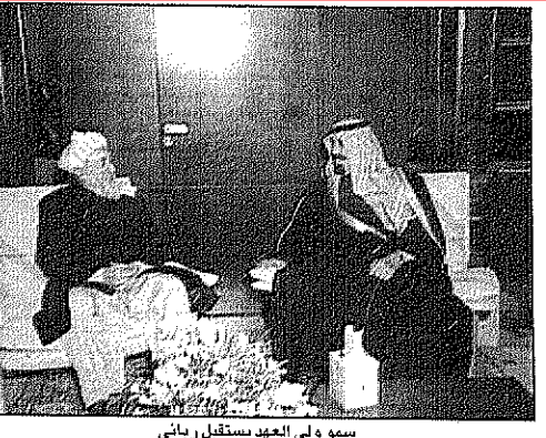
سمو ولي العهد يستقبل رباني