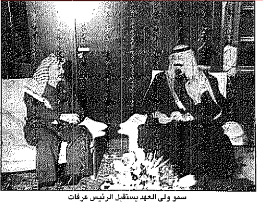
سمو ولي العهد يستقبل الرئيس عرفات