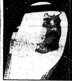
سمو الأمير سلطان

السعودية - الرياض: استقبل صاحب السمو الملكي الأمير سلطان بن عبدالعزيز النائب الثاني لرئيس مجلس الوزراء وزير الدفاع والطيران والمفتش العام مكتب سموه بالمعهد بعد ظهر أمس الفريق أول / سعيد محمد خان رئيس أركان القوات البحرية الباكستانية والوفد المرافق له الذي يزور المملكة هذه الأيام. وفي نهاية المقابلة قلّد سمو النائب الثاني الضيف وسام الملك عبد العزيز من الدرجة الثانية تقديراً لما تقوم به القوات البحرية الباكستانية من دور مؤثر وبناء في العلاقات الثنائية المتميزة التي تربط المملكة العربية السعودية ودولة باكستان. كما استقبل سمو الأمير سلطان مكتب سموه بالمعهد بعد ظهر أمس كبار ضباط القوات المسلحة الذين قدموا للسلام على سموه وتهنئته بسلامة الوصول بعد