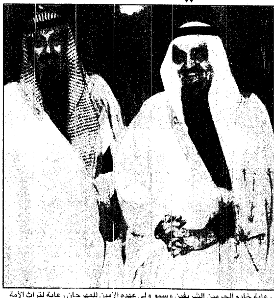
رعاية خادم الحرمين الشريفين وسمو ولي عهده الأمين للمهرجان برعاية لترات الأمة وحضارتها الأصيلة والمتطورة

سعود المصبيح - الرياض: نيابة عن خادم الحرمين الشريفين الملك فهد بن عبدالعزيز آل سعود يرعى بمشيشة الله صاحب السمو الملكي الأمير عبدالله بن عبدالعزيز ولي العهد ونائب رئيس مجلس الوزراء ورئيس الحرس الوطني حفل افتتاح المهرجان الوطني للتراث والثقافة العاشر في الجنادرية اليوم الأربعاء. وقد أكد صاحب السمو الملكي الأمير بدر بن عبدالعزيز نائب رئيس الحرس الوطني ورئيس اللجنة العليا للمهرجان الوطني للتراث والثقافة أن الرعاية التي يحظى بها هذا المهرجان من مقام خادم الحرمين الشريفين وسمو ولي العهد واهتمامه الكبير الذي وصل إليها هذا المهرجان كأكبر حدث ثقافي وتراثي عربي. وأوضح سموه في حديث خاص لـ«عكاظ» أن المهرجان الذي تنطلق فعالياته اليوم يجسد خلاصة جهد وعطاء متكامل يوصل الدور الحضاري الذي يقوم به الحرس الوطني كمؤسسة تعنى بالإنسان أولاً. وأكد سموه أن الاستعدادات قد اكتملت لانطلاق «الجنادرية ٩» اليوم حيث تضاعفت الجهود لإبراز هذا المهرجان بالصورة المثلى لكي يحقق أهدافه في التعريف عن ثقافة وفكر المملكة العربية السعودية النابع من الدين الإسلامي الخفيف ومن التقاليد والعادات العربية الأصيلة والاهتمام بالأدب والثقافة وتنمية الأثر الفكرية والحضارية لإبناء المملكة أئذين في الاعتبار أهمية التواصل مع الأجيال في الدول العربية والإسلامية. ونشر سموه إلى أن مهرجان هذا العام سوف يشهد بعض التغييرات خاصة في القرية الشعبية إضافة إلى مشاركات من المناطق التراثية ومشاركة العديد من الجهات لأول مرة كما تشهد العديد من