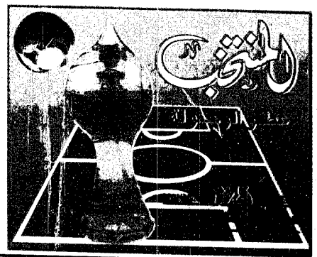
فهد بن عبدالعزيز آل سعود

السنة الخامسة والاولون - العدد 1005 - 28 شعبان 1414هـ الموافق 8 فبراير 1994م