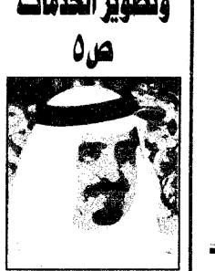
سمو الامير ماجد

ابن باز يحذر من ما يبطل أركان الإسلام المشتري 19 ص