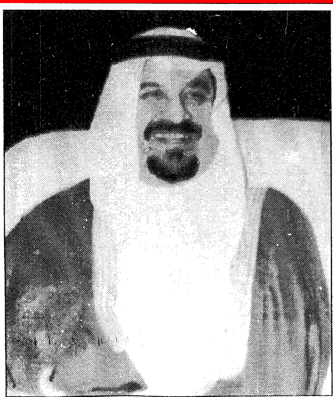
سمو الامير سلطان

السعودية - مكة المكرمة: رفع صاحب السمو الملكي الامير سلطان بن عبدالعزيز النائب الثاني لرئيس مجلس الوزراء وزير الدفاع والطيران والمفتش العام الى خادم الحرمين الشريفين الملك فهد بن عبدالعزيز والى سمو ولي عهده الامين صاحب السمو الملكي الامير عبدالله بن عبدالعزيز للتهنئة بعيد الفطر المبارك باسم رجال القوات المسلحة جاء ذلك في كلمة بهذه المناسبة فيما يلي نصها: بسم الله الرحمن الرحيم والصلاة والسلام على اشرف الانبياء والمرسلين. ايها الاخوة والزملاء منسوي القوات المسلحة في المملكة العربية السعودية. احببكم بتحية الاسلام واهنتكم بعيد الفطر المبارك بعد ان انقضى شهر الصوم والصبر والفقران راجيا من الله سبحانه وتعالى ان يمن علينا جميعا بفضائل رحمته ومغفرته سبحانه وتعالى وان يتقبل منا جميعا واخوانتنا المسلمين صيام هذا الشهر الفضيل وان يجعلنا جميعا من المقبولين لامن المردودين ويجعلنا من المرحومين لامن المحرومين. ايها الاخوة اوجه التهنية لخادم الحرمين