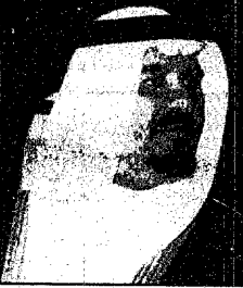
سمو الامير سلطان

السعودية - الرياض: استقبل صاحب السمو الملكي الامير سلطان بن عبدالعزيز النائب الثاني لرئيس مجلس الوزراء وزير الدفاع والبيهران والمفتش العام بكتيب سموه بالمعهد بعد ظهر امس الفريق اول / سعيد محمد خان رئيس اركان القوات البحرية الباكستانية والوفد المرافق له الذي يزور المملكة هذه الايام. وفي نهاية المقابلة قلّد سمو النائب الثاني الضيف وسام الملك عبد العزيز من الدرجة الثانية تقديراً لما تقوم به القوات البحرية الباكستانية من دور مؤثر وبناء في العلاقات الثنائية المميّزة التي تربط المملكة العربية السعودية ودولة باكستان. كما استقبل سمو الامير سلطان بكتيب سموه بالمعهد بعد ظهر امس كبتاب ضيفات القوات المسلحة والوفد المرافق له في عهده بمناسبة عيد الفطر المبارك للمسوري سموه وتهنئة بسلامة الوصول بعد