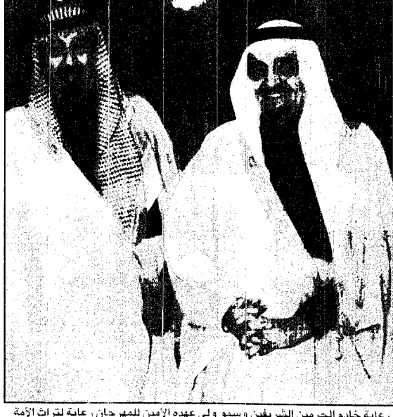
رعاية خادم الحرمين الشريفين وسمو ولي عهده الامين للمهرجان رعاية لترات الامة وحضارتها الاصلية والمنتظرة