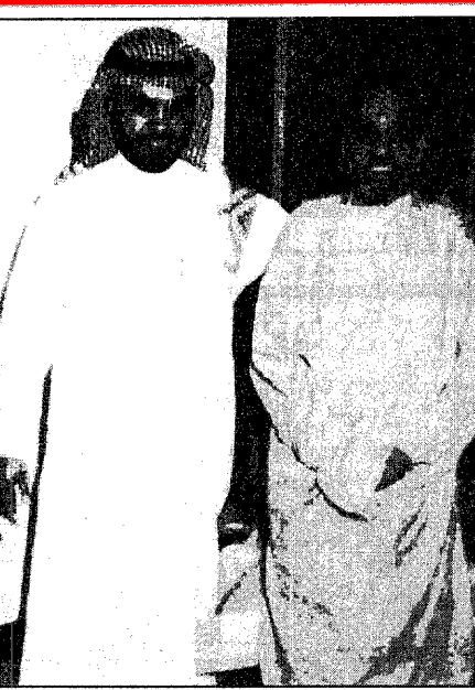
المريض مع ابن اخيه