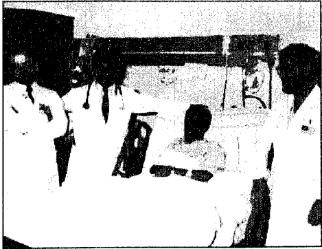
الفريق الطبي الذي اجري عملية الكبد