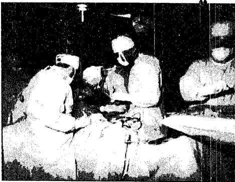
الفريق الجراحي يستعد لزراعة الكبد بمستشفى الملك فهد