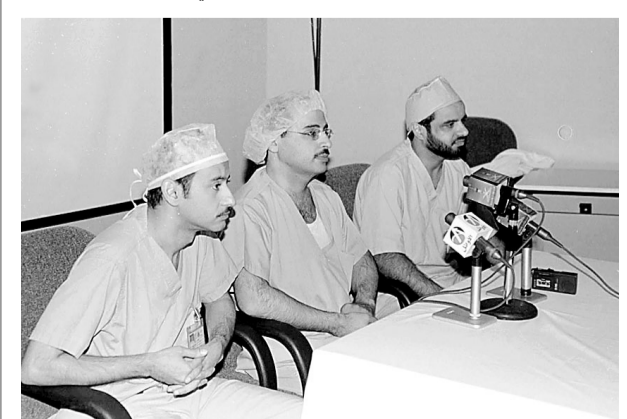
الاطباء أثناء المؤتمر الصحفي