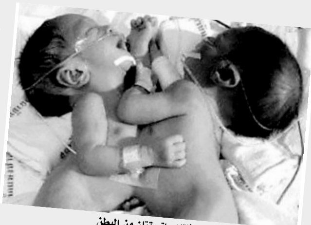
طفلتان ملتصقتان من البطن

بعد ١٣ يوماً من التلقيح، مؤكداً انه لا يمكن منع الالتصاق في الايام الأولى للحمل لانه عيب خلقي غير معروف السبب، كما ان الاطباء لا يستطيعون فصل طفلين ملتصقين وهما جنين في بطن الأم لعدم معرفة مكان العيب الخلقي. ويؤكد الدكتور وجدي عبدالفتاح ان التوائم لا يتطابقون في بصمة البتان او الصوت او الشفاة او العين او بصمة الجينات، مبيناً انه لا يتشابه اثنان يعيشان على كوكب الارض في جميع الصفات الوراثية وينطبق نفس الشيء على كل انواع الكائنات الحية، وهذا التنوع الاحيائي اللانهائي الموجود في كل الكائنات الحية انما يمثل أحد ابدان قدرة الخالق سبحانه وتعالى. وكل يوم يخرج علينا العلم بما هو جديد ومثير عن هوية الانسان، مما يؤكد عظمة الله عز وجل وعجز العلم الحديث بوسائله وعلمائه عن معرفة كل الاسرار التي اودعها الله في خلقه ومخلوقاته.