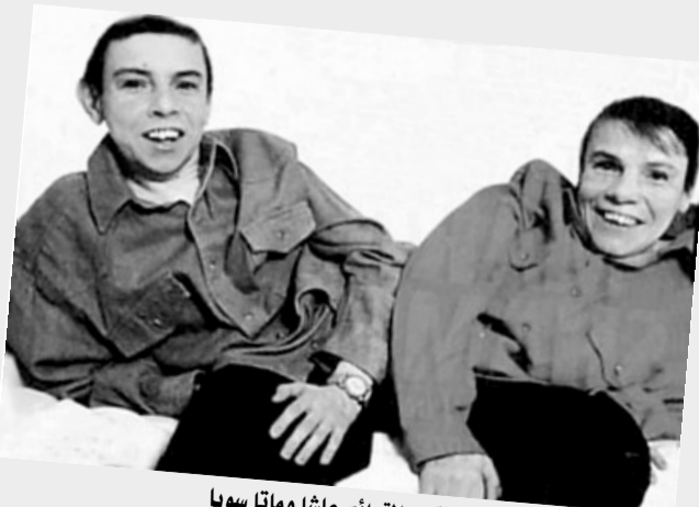
اكبر التوائم عاشا وماتا سويا