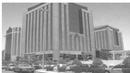
قسم الطالبات: جدة شارع ولي العهد - مركز جدة لرجال الأعمال - الدور الرابع - هاتف: ٩١٠٠٦١٢ - فاكس: ٩١٠٠٦١١