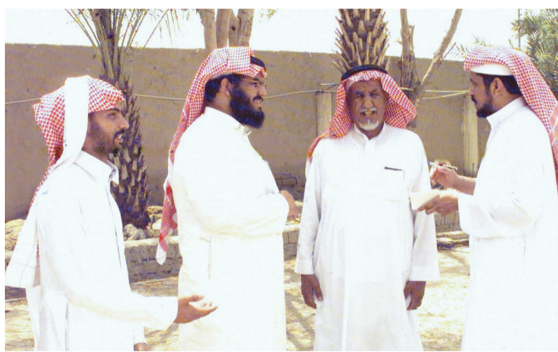
الاهالي: نستنكر ما قام به الارهابيون

المواطنين وخاصة ولاه امرهم من آباء وامهات مراقبة سلوك ابناءهم حتى لا يقعوا فريسة سهلة لاصحاب الافكار المنحرفة.. وسأل الملك فهد بن عبدالعزيز وسمو ولي عهده الامين وسمو النائب الثاني علي ما يولونه من اهتمام بابنائهم المواطنين. وقال عديريه عابد القرشي: ان هذه الاحداث زادت من قوة التلاحم بين ابناء هذا الوطن لأن هؤلاء الشباب قد غر بهم وباعوا انفسهم والتخريب وازهاق الانفس التي