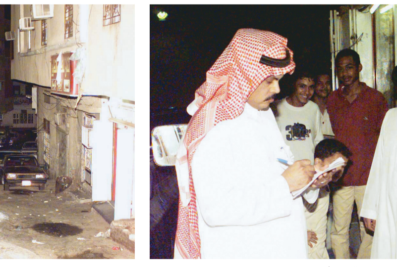
شباب العتيبية يتحدون لـ «عكاظ»