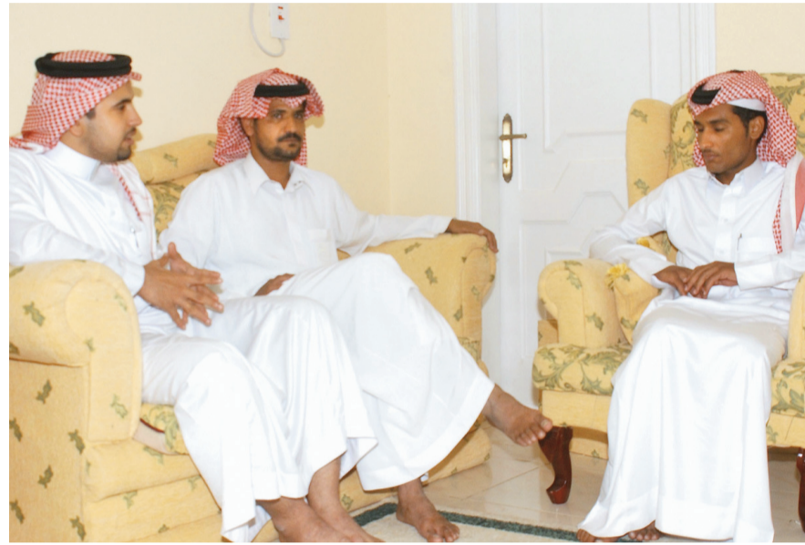
بجد وجهاد شقيقا الشهيد يتحدثان لـ «عكاظ»