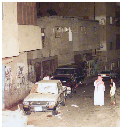
احد مداخل الحي