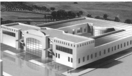
قسم الطلاب: جده حي الروضة شارع الجامعة - طابق شارع سوري - هاتف: ٩١٠٠٦٧١ - فاكس: ٩١٠٠٦٧٢