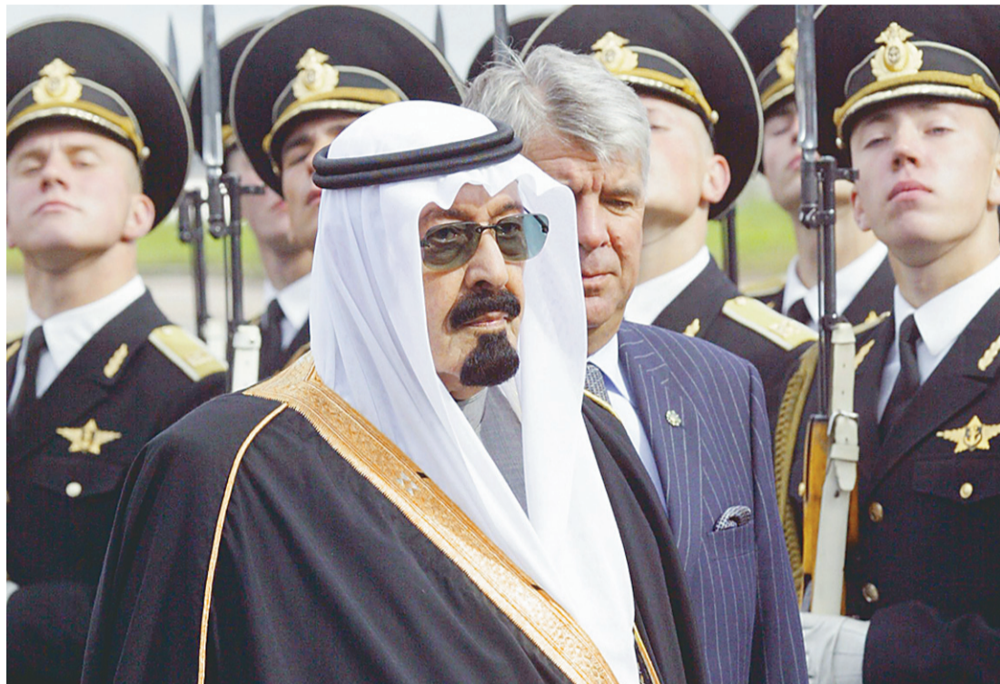
سمو الأمير عبدالله يستعرض حرس الشرف لدى وصوله الى موسكو