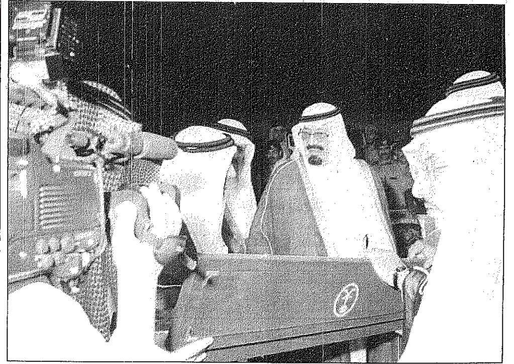
سمو ولي العهد يتسلم مدينة تذكارية من اهالي المنطقة