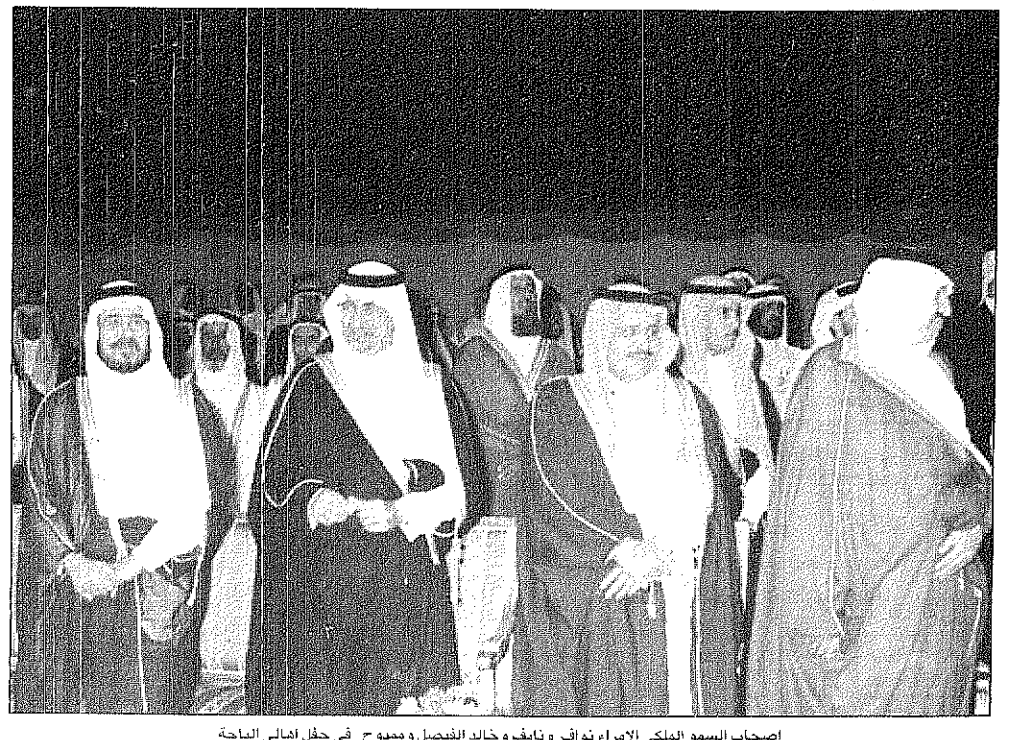
اصحاب السمو الملكي الامراء نواف ونايف وخالد الفيصل ومموح في حفل اهالي الباحة