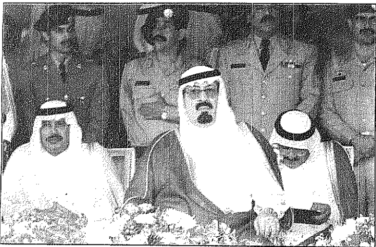
سمو ولي العهد في حفل اهالي الباحة

واجلادك في باحتك الجميلة. والسلام عليكم ورحمة الله وبركاته. عقب ذلك القيت عدد من القصائد الشعرية. ثم شاهد سمو ولي العهد وصحبه الكرام عرضاً وثائقياً وفتياً بعنوان «الباحة وفضول من العطاء» تناول الانجازات التي تحققت في المنطقة في مختلف المجالات ومدى ما تحققت للمنطقة من تطور ورفاهية. كما شاهد سموه والحضور اوبريتاً فنياً من اداء الفنان عبدالله رشاد. ثم قدم صاحب السمو الملكي الامير محمد بن سعود بن عبدالعزيز امير منطقة الباحة مدينة تذكارية لسمو ولي العهد بمناسبة هذه الزيارة. بعد ذلك عزف السلام الملكي ثم غادر سموه مقر الحفل مودعاً بمثل ما استقبل به من حفاوة وتكريم. وقد حضر حفل العشاء والحفل الخطابي والفتي صاحب السمو الامير سعود بن محمد بن عبدالعزيز آل سعود وصاحب السمو الامير محمد