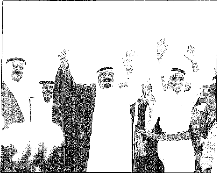
سمو ولي العهد شارك المواطنين فرحتهم