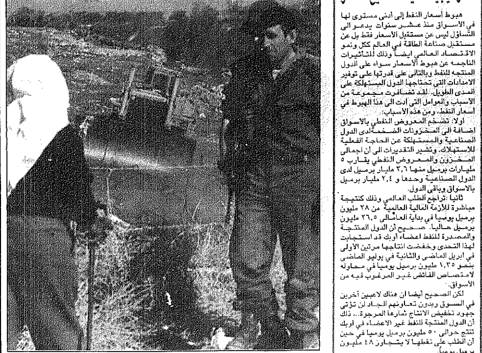
مزارع فلسطيني في مواجهة جنديين اسرائيليين حيث تدمر الجرافات حفل الزيفون وتواصل شق الطرق الاستثنائية في الضفة - عكاظ ورويتزر -

الاول منذ عامين.. ويعتقد اتفاق واي بلانتيشن ستخضع بعض المناطق الريفية المحيطة بالمدينة لسيطرة فلسطينية كاملة مثل تلك التي حصلت عليها جنين نفسها في ديسمبر ١٩٩٥. وفي مكتب اتصال اعطى ضباط بالجنين الاسرائيلي نظارهم الفلسطينيين خرائط للأراضي التي ستسقط سلطة الحكم الذاتي وجاب ضباط من الجانبين المنطقة معاً. وشارك نحو خمسة آلاف شخص منهم طلبه واعضاء فرق كشافة في الاحتفال بوسط جنين في شمال الضفة الغربية. ومهد مجلس الوزراء الاسرائيلي أمس الخميس