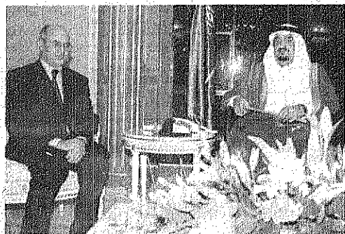
خادم الحرمين الشريفين أثناء استقباله الوزير الجزائري