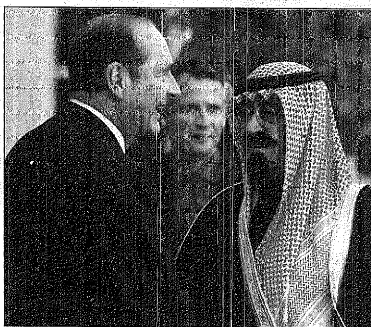
ترحيب بالغ قبول به سمو ولي العهد من الرئيس الفرنسي في بداية زيارته الرسمية

واس لندن اولت الصحف العربية اهتماما خاصا بجولة سمو صاحب السمو الملكي الامير عبدالله بن عبدالعزيز ولي العهد ونائب رئيس مجلس الوزراء ورئيس الحرس الوطني على عدد من العواصم العالمية مركزا على زيارته لبريطانيا باعتبارها المحطة الاولى في الجولة... واصبحت على الامة التي تكتسبها الزيادة ودورها في تدعيم العلاقات الثنائية بين البلدين وعرض المستجدات على الصعيد العربي والاقليمية والدولية... وقد ركزت صحيفة الغاربي التي تصدر في لندن على أهمية الدور الذي يضطلع به سمو ولي العهد على صعيد نصرة قضايا الحق والعدل وخاصة قضايا العرب والمسلمين وجهوده المميزة من اجل توحيد الصفوف العربية وتصفية الاجواء العربية... وقالت ان سمو الامير عبدالله بن عبدالعزيز يحمل على تكريس التفاهم والتعاون التاريخي بين المملكة وبريطانيا مقدمتها القضية الفلسطينية... من جانبها نظرت صحيفة الاميرام المصرية الى التحدي الواسع الذي خطى به سمو ولي العهد خلال زيارته لبريطانيا وكذلك الموضوعات المطروحة للبحث خلالها العلاقات السعودية البريطانية وما تتميز به من عمق ومناخ... واشارت كذلك الى زيارة سموه لفرنسا