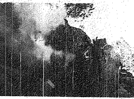
فرق الدفاع المدني أثناء السيطرة على الحريق

الحارثي ان اسباب اشتعال الحريق قد تكون عائدة لأشغال بعض رعاة الختم التي في تلك المنطقة وتعتبر الشور واشتغال النار في الأشجار التي تسببت