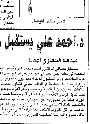
الامير خالد الفيصل