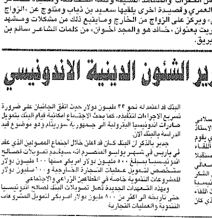
الامير خالد الفيصل