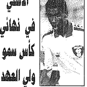
المشعل التفاصيل صفحات الرياضة