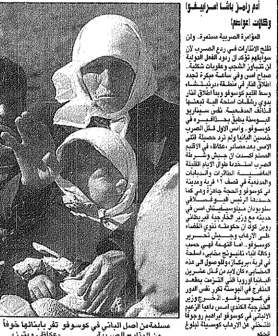
مسلمة من اصل الباني في كوسوفو تفر بابنائها خوفاً من المذابح الصربية.