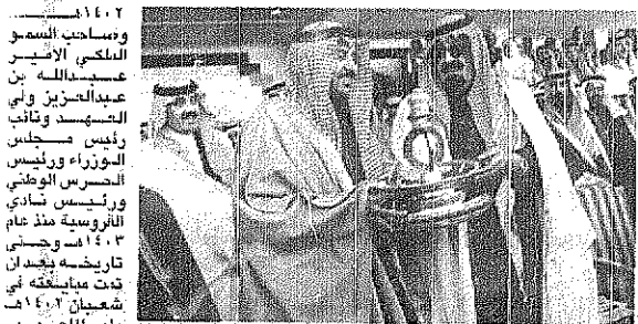
ويولي سموه هذه الرياضة اهتماماً خاصاً نابعاً من حبه لها... وشهدت تطوراً كبيراً وبحوثاً على يده يحفظها، الله منذ انشاء الفروسية عام ١٣٨٥ هـ وحتى الآن.

ثلاث اسبوعاً في ثلاثة عهود كريمة. احتضنت هذه الكاس، وتعهدت بالرعاية والدعم. جلالة الملك خالد رحمه الله الذي كان ولياً للعهد عندما انطلقت المسابقة عام ١٣٨٧ هـ. وحمى عام ١٣٩٤ هـ وخادم الحرمين الشريفين الملك فهد بن عبدالعزيز بعد وفاة جلالة الملك فيصل رحمه الله وحتى عام ١٣٩٥ هـ.