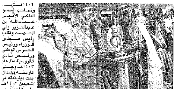
ويولي سموه هذه الرياضة اهتماماً خاصاً نابعاً من حبه لها... وشهدت تطوراً كبيراً وبحوثاً على يده يحفظها، الله منذ انشاء الفروسية عام ١٣٨٥م وحتى الآن.

ثلاث اسبوعاً كريمة، في ثلاثة عهود كريمة. احتضنت هذه الكاس، وتعهدت بالرعاية والدعم... جلالة الملك خالد رحمه الله الذي كان ولياً للعهد عندما انطلقت المسابقة عام ١٣٨٧م وحسن عام ١٣٩٤م وخادم الحرمين الشريفين الملك فهد بن عبدالعزيز