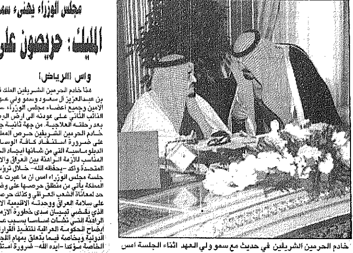
خادم الحرمين الشريفين في حديث مع سمو ولي العهد أثناء الجلسة امس