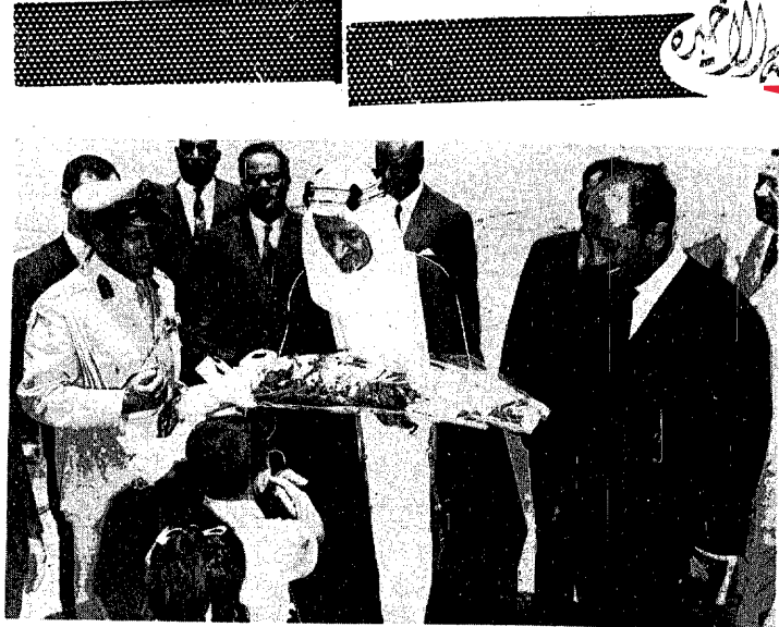
جلالة الفيصل المدي يتقبل بحنان ابوي باقة من الورد والزهور من طفل في عمر الزهور لدى وصول جلالاته الى مطار القاهرة الدولي امس.

يعلم مشيب بن شافي بن مدغش عن فقد حفيظة نفوسه رقم ٥٣٩ وتاريخ ١٥-٧٧ سجل مكة يرجو كل من يعثر عليها يسلمها الى الحرس الوطني اللواء الثالث بام السلم وله الشكر.