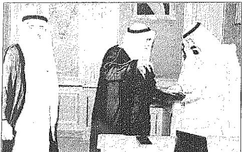
سمو ولي العهد لدى استقباله أعضاء مجلس إدارة غرفة جدة